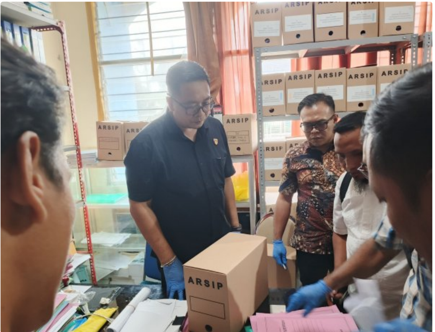
Saat Pengeledahan di Dikbud NTB, Jumat (13/12/2024)