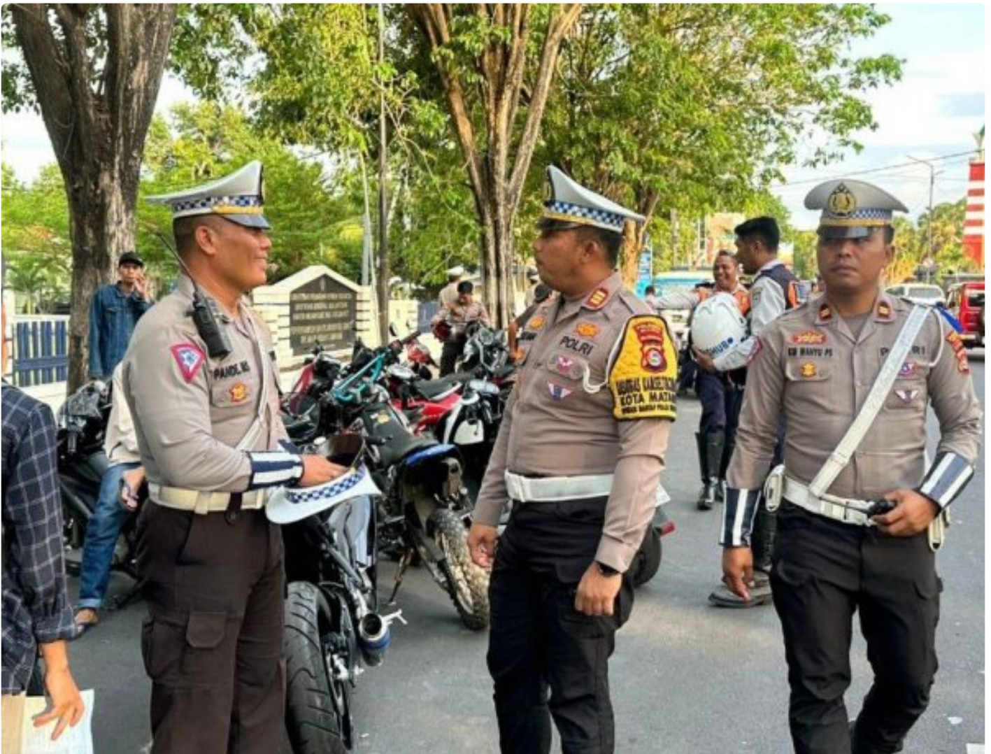
Operasi Zebra Rinjani 2024 Polresta Mataram hari kedua, (15/10/2024)

Mataram NTB - Jumlah pelanggar pada pelaksanaan Ops Zebra Rinjani 2024 Polresta Mataram Hari Kedua Meningkat dibandingkan Ops Zebra Hari Pertama. Dari dua kali kegiatan per hari, dalam Ops Zebra di Hari kedua ini jumlah surat